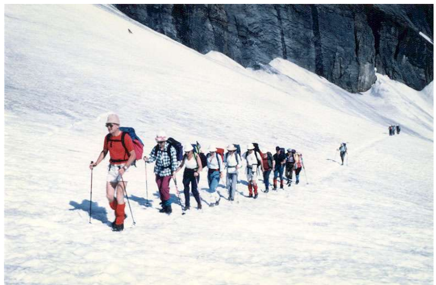
Schnee, Schnee, Schnee beim und auf dem Lötschegletscher

terpartie, die mit befestigten Drahtseilen etwas Sicherheit bietet. In einer geschützten Mulde halten wir Mittagsrast. Nur noch ein Schneefeld trennt uns von der Hütte auf dem Pass. Den Kaffee wollen wir uns dort genehmigen.