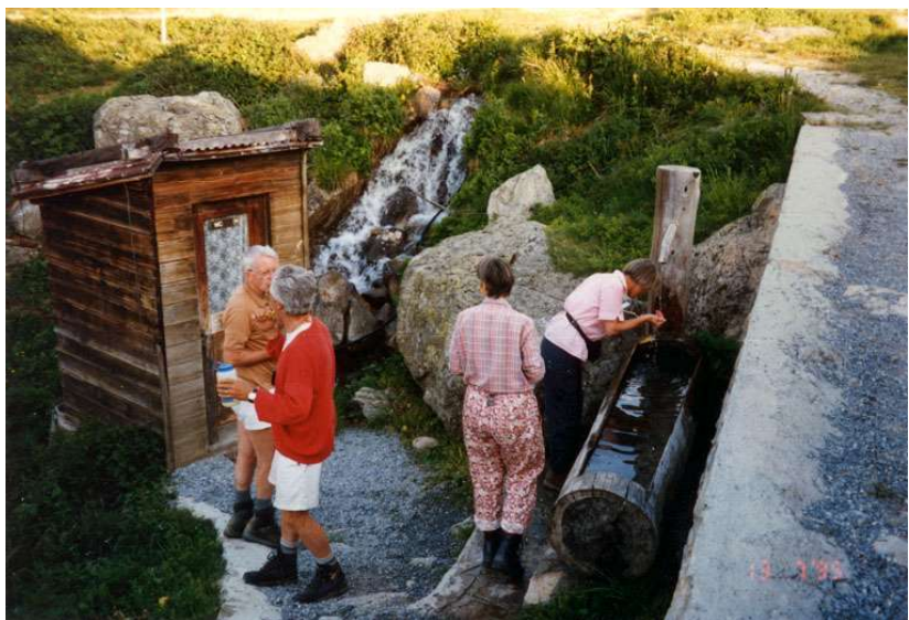
die Felsbarriere am Lötschenpass

Auf eine Dusche haben wir uns heute wieder vergebens gefreut. Am Brunnen muss man Schlange stehen, so suche ich hinter dem Haus das lauschige Plätzli auf am klaren Bergbach. Inmitten der Alpenblumen und duftenden Mänertreu braucht es eigentlich kein langes Zögern und Wasser kalt oder nicht, für einen erfrischenden Moment sitze ich halt ganz im Bach. Zu spät bemerken wir drei Frauen, dass der Wanderweg auf der andern Seite des