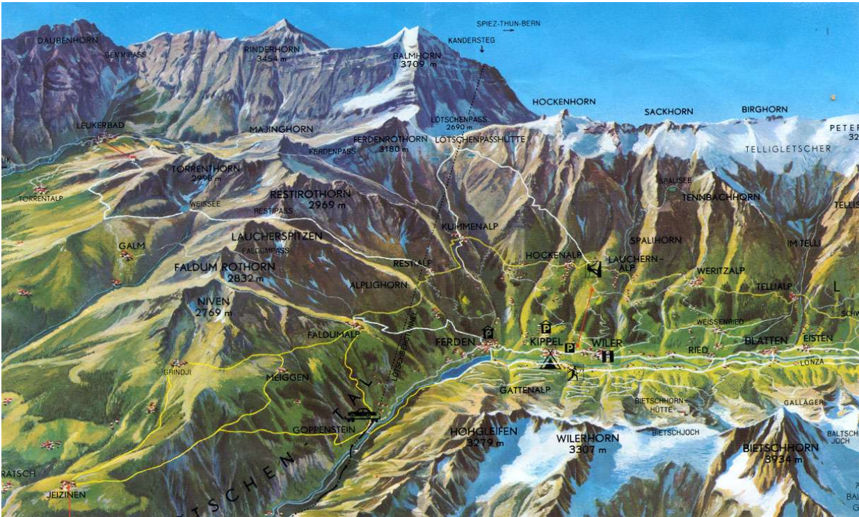
die Felsbarriere am Lötschenpass