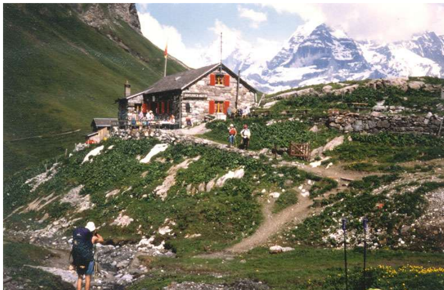
Rotstockhütte auf der Poganggenalp

Nach einem währschaften Älplerznacht in dieser Hütte des SC Stechelberg, auf 2039 Metern, ziehen wir noch die Aussicht auf die weisshäuptigen Eiger, Mönch und Jungfrau ein. Bis es dunkel wird und die Ersten sich in die schmalen, spartanischen Himmelbetten zurückziehen, schwingen sich muntere Weisen aus dem Lalibu dem fast 1000 Meter höhergelegenen Drehrestaurant des Schilthorns entgegen.