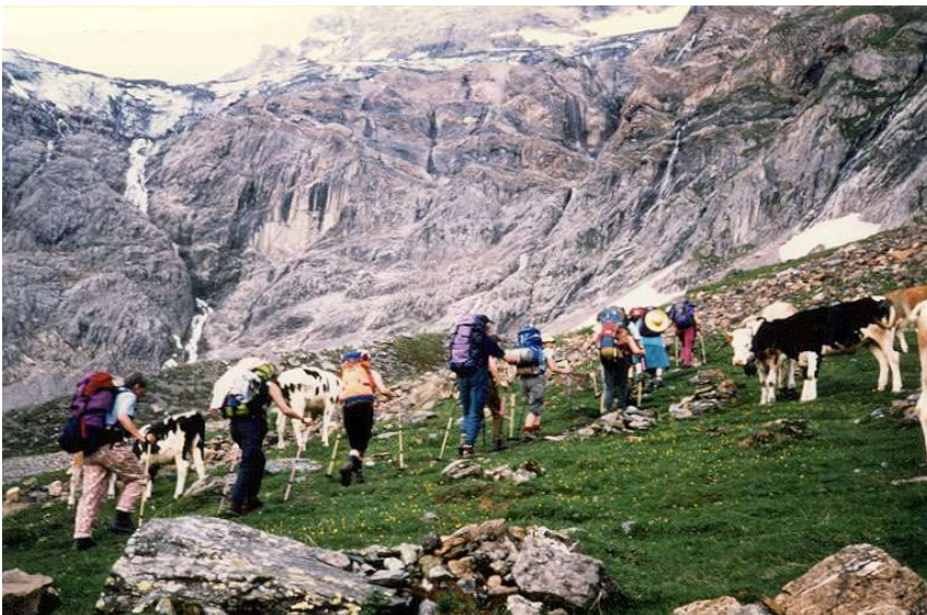
die Felsbarriere am Lötschenpass

terpartie, die mit befestigten Drahtseilen etwas Sicherheit bietet. In einer geschützten Mulde halten wir Mittagsrast. Nur noch ein Schneefeld trennt uns von der Hütte auf dem Pass. Den Kaffee wollen wir uns dort genehmigen.