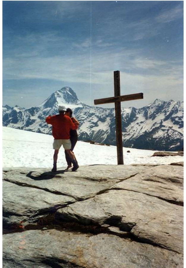
Tanz auf dem Lötchenpass

Bei soviel Besuch aufs Mal lohnt sich's für den jungen Burschen von der Hütte, sein Örgeli hervorzuholen und uns eins zu spielen. Von der Wirkung seiner Klänge selbst überrascht, muss er nun sicher sein ganzes Repertoire, welches er ohne Noten lesen zu können lernt, durchspielen. Man spielt nämlich nicht ungestraft einer Volkstanzgruppe auf, ohne dass das nicht eine Herausforderung ist. Und sei's mit Wanderschuhen und Blasen an den Füssen. In so einem Moment wird Müdigkeit klein geschrieben. Und wozu hat der Gletscher vor Jahrtausenden eine so feine Tanzfläche geschliffen? Nun ist die Kummenalp sicher schon in greifbarer Nähe, geht's doch von hier „nur noch“ bergab. Eigentlich ist das meiste nur Schneefeld. Des einen Wonne und des andern Horror. Diesmal gehöre ich glaub schon zu den einen. Mir macht's Spass. Aber ganz ungetrüb ist dieser doch nicht, bange ich doch mit denen, die mehr die