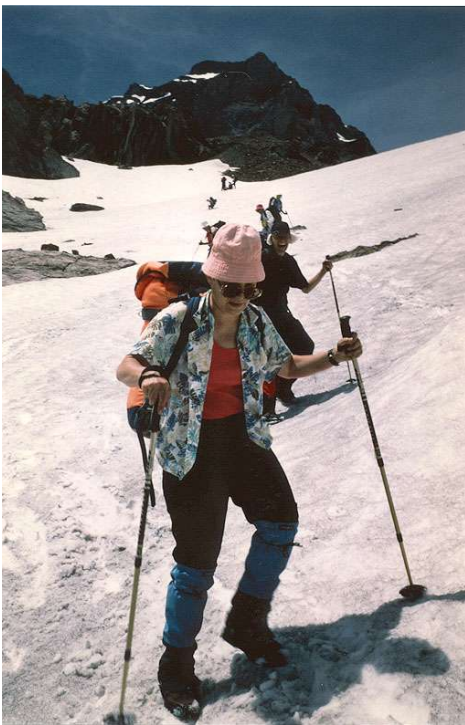
Abstieg im Schnee – des Einen Freud...