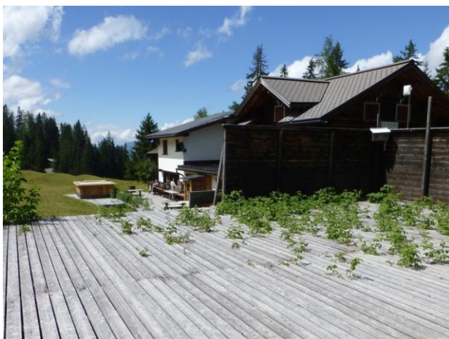
auch die Serneuser Schwendi ist verlassen

Dann kommen Weidenröschen in Germer- und Enzianwiesen, Bäche sind zu überqueren und immer wieder habe ich die Möglichkeit, Schafgarben zu knipsen. Sie sind weiss oder rosa, haben meist gefiederte Blätter, aber einmal auch deutlich anders. Ich werde damit dann daheim die Moschus-Schafgarbe bestimmen. (Ich fand sie unter meinen Jagdtrophäen, aber es war jene, die ich im Süsertal drüben dann auf steinigem Boden gefunden habe.)