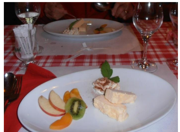
Ivaparfait mit Früchten