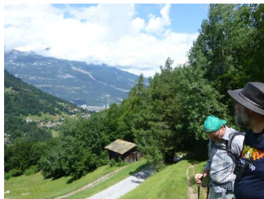
Chur liegt schon tief unten