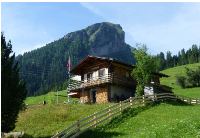
Holz vor den Haus und Weisshorn dahinter