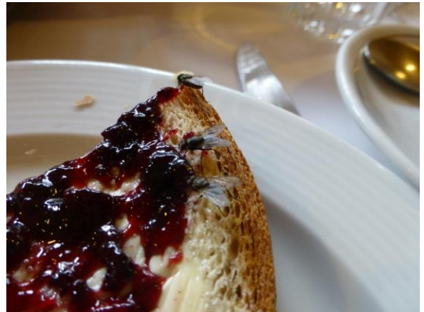
...also lassen wir sie gewähren