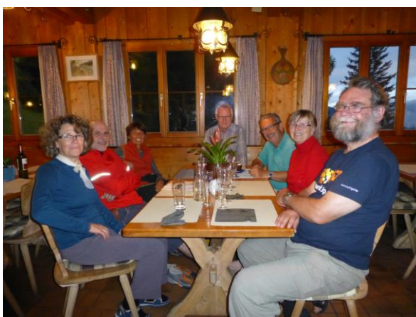
nun haben wir Hunger