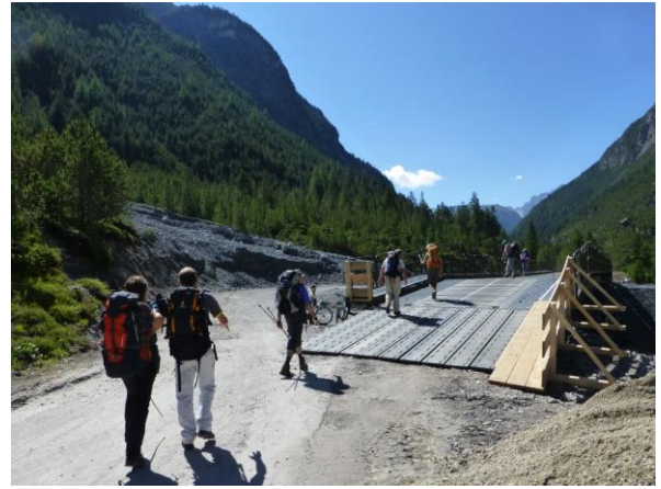
die provisorische Militärbrücke