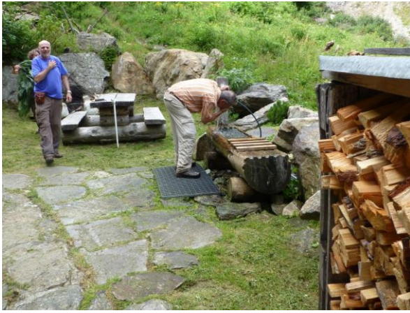
verlockender Brunnen im Vorgarten

Bald ist es nicht mehr so steil und wir erreichen die Fahrstrasse, welche aber noch auf zweieinhalb Kilometer unseren wackeligen Knien und müden Beinen zusetzt. 1150 Meter Abstieg heute waren nicht ganz ohne!