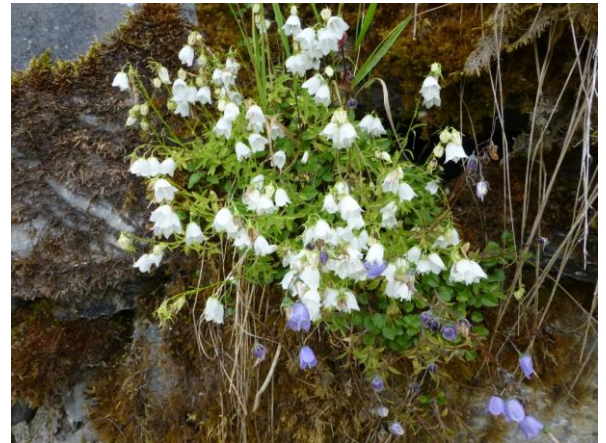
Glöcklein am Wegrand