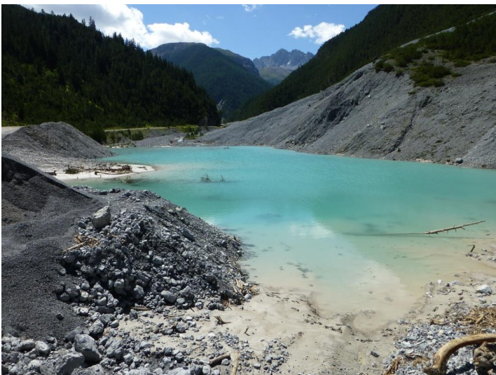
der neu aufgestaute See