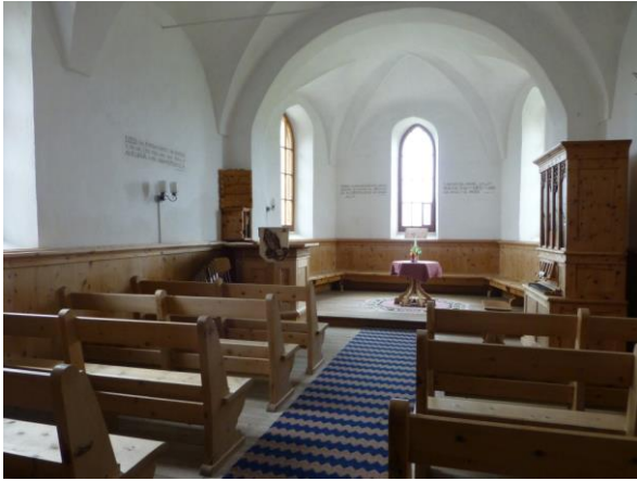
in der Kirche