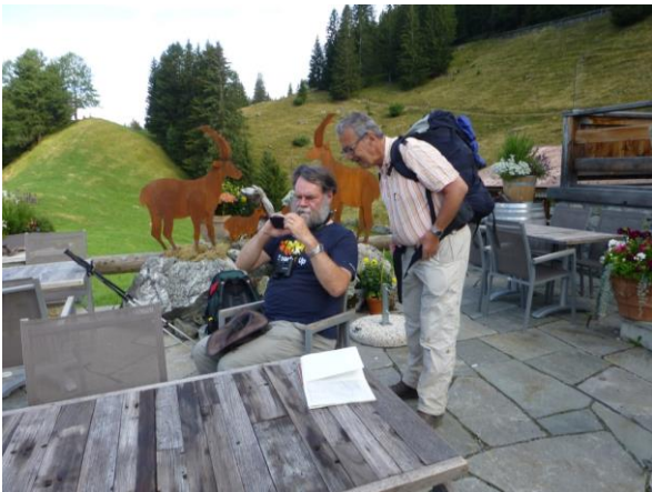
vor dem Start im Alpenrösli