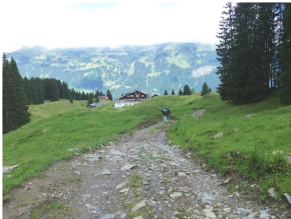
in der Conterser Schwendi