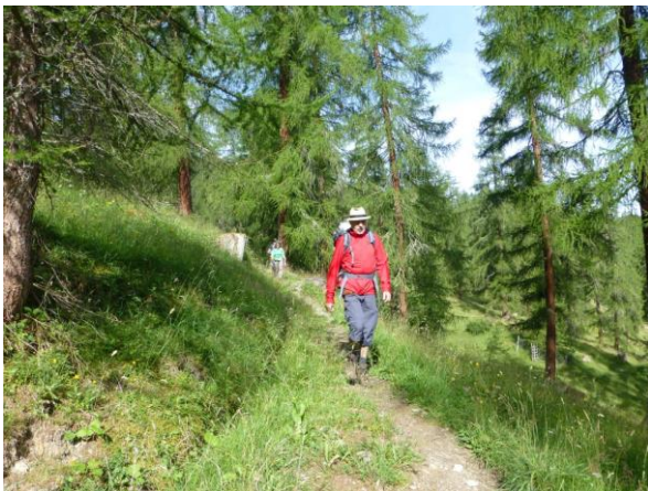
durch lichten Lärchenwald