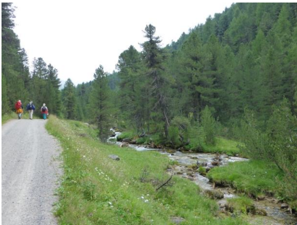
entlang der Clemgia