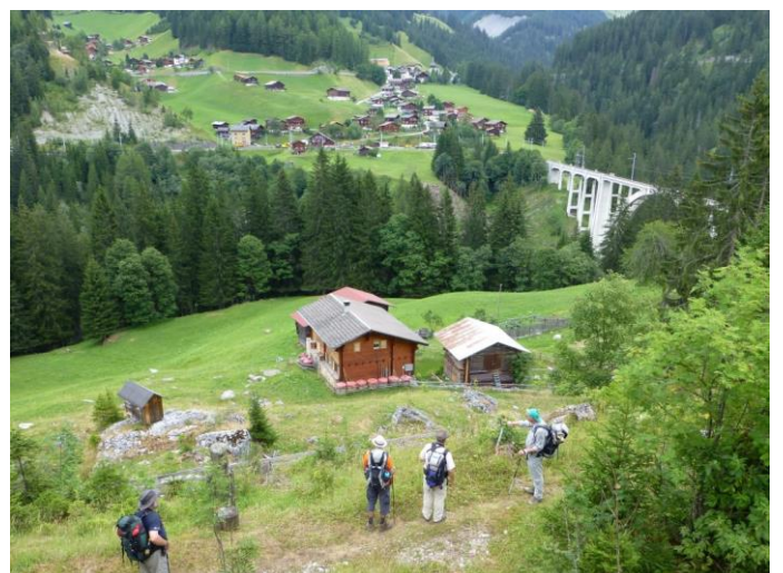
Blick vom Aussichtsturm aufs Langwieser Viadukt