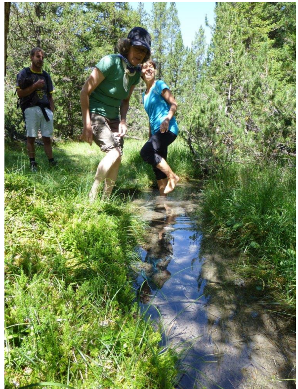
kneippen im Waldbächlein

Zuerst besteht dieser Teppich aus Gras, durch welches sich ein kleines Wässerchen schlängelt, in dem man unbedingt barfuss kneippen muss. Später besteht das