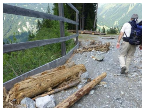
der Bach hat gewütet

Brüggli, wo bist du? Ein Murgang hat das Bachbett hier garstig ausgewaschen und für eine Weile die Strasse als Fluss missbraucht. Ausgefranztes Schwemmholz, Geröll und Steine begleiten uns noch ein gutes Stück des Weges.