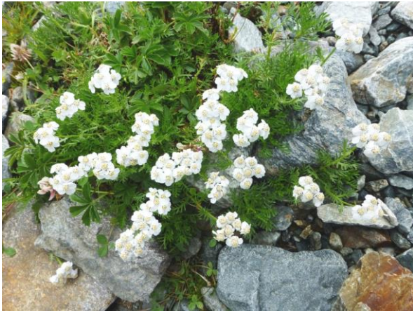
Iva oder Moschus-Schafgarbe