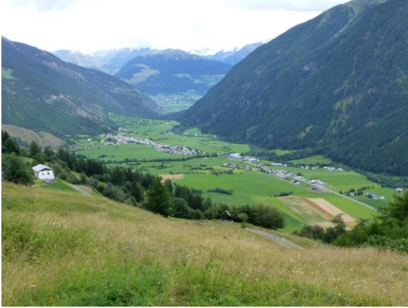
bis an die Grenze

Es ist ein schöner Abschluss unserer Wanderung, die uns heute über aussichtsreiche Höhen, manchmal vorbei an Alpweiden und oft durch lichten Lärchen- und Tannenwald führt, wo der aufgeweichte Boden manchmal mit Tannzapfen dicht übersät ist. Oft meinen wir, dass wir nun das Ende des allerdings sanften Aufstiegs erreicht haben, aber immer steigt der Weg hinter ein, zwei Wegbiegungen wieder an. Auf der Karte sehen wir, dass wir uns über sechs Kilometer immer zwischen 1900 und 2000 m.ü.M bewegen und so muss ich mir gerade sicherstellen, dass wir den heutigen höchsten Punkt und Gelegenheit für den letzten Gipfelkuss nicht verpassen. Bei Terza auf 2050m kann ich diesen ‚Höhepunkt‘