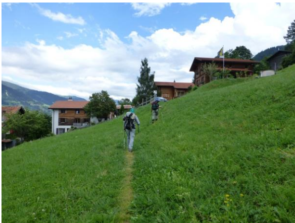
in Usser-Praden angekommen