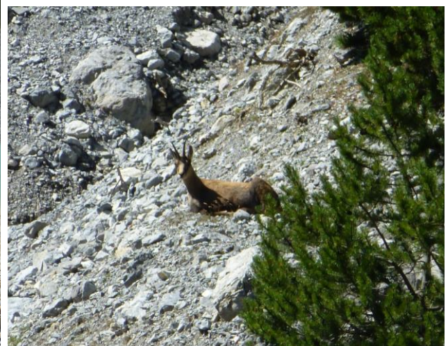
Gämse auf der Nationalparkseite