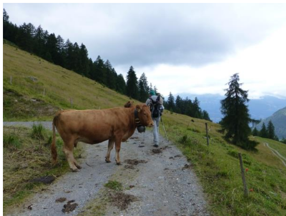
sie stehen uns im Weg herum

So verkrieche ich mich heute nach einem wohlverdienten, wunderbaren Nachtessen aus Cordonbleu mit Pizokels und Bohnen nur mit geputzten Zähnen, ansonsten ungewaschen im Frauenschlag in die unterste Etage des dreistöckigen Kajütenbettes. Ich könnte mir vorstellen, dass man in den Katakomben noch mehr Platz hatte, aufsitzen im Bett kann man vergessen. Zum Glück haben wir Frauen wenigstens die zweite Matratze neben uns zur Verfügung.