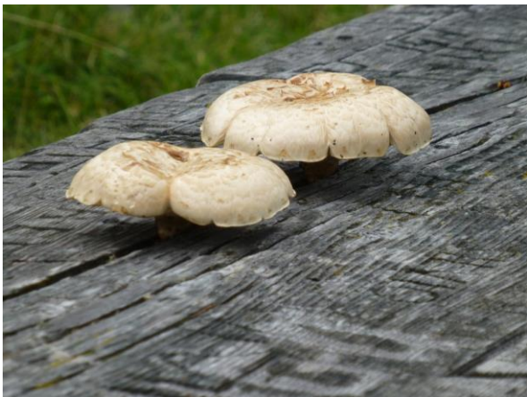
Pilze wachsen auf dem Tisch