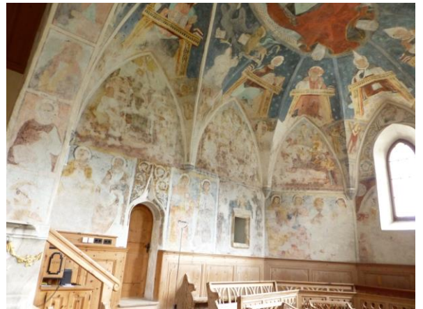
ein Blick in die Kirche in Lavin lohnt sich