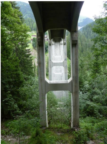
unter der Brücke

Grill und Spaltholz und skurrilen Holzskulpturen vorbei, aber vor allem mit einem Brunnen, dessen Wasser in einen langen, ausgehöhlten Baumstamm plätschert.