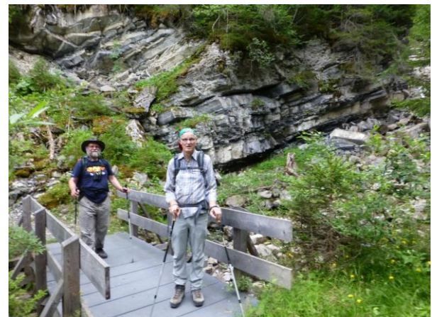
über sieben Brücken

Etwas oberhalb Grida geht es wieder in den Wald und man hat bald das Gefühl, dass nun der grösste Teil des Stützes bezwungen ist.