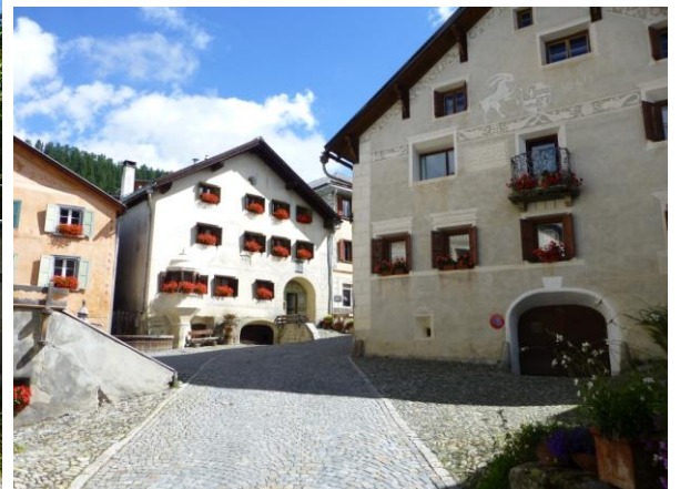
Dorfbild in Guarda