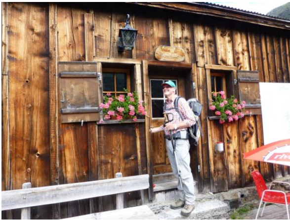
die Villa Holzschopf