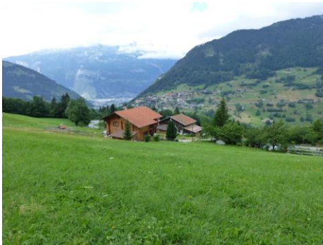
Blick nach Maladers und Chur