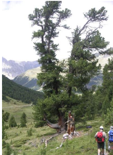
...noch vor zehn Jahren....

Bald werden die hohen Bäume wieder kleiner und vereinzelter und grüne, weite Alpweiden lösen den Wald ab. Wir kommen wieder hinunter zum Fahrweg, welcher emsig von Bikern be-