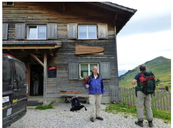
im Berggasthaus Strassberg

Nachher kann man dann in den Zweierzimmern mit den karierten Duvets noch besser schlafen.