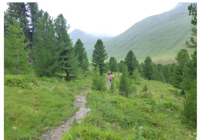
weiter im God Tamangur