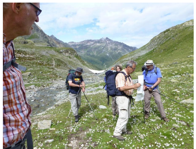
Margritenwiese am Flesspass