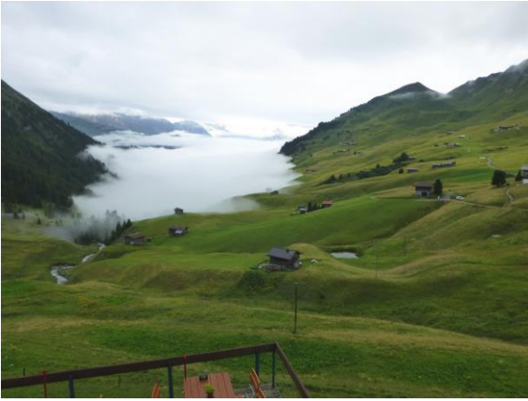
die Streusiedlung im Fondoi