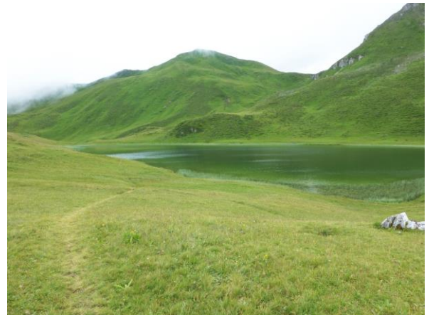
der grasgrüne Grünsee