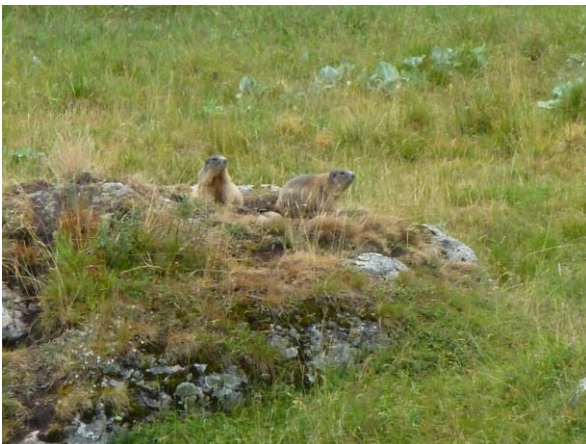
so sehen Murmeltiere aus