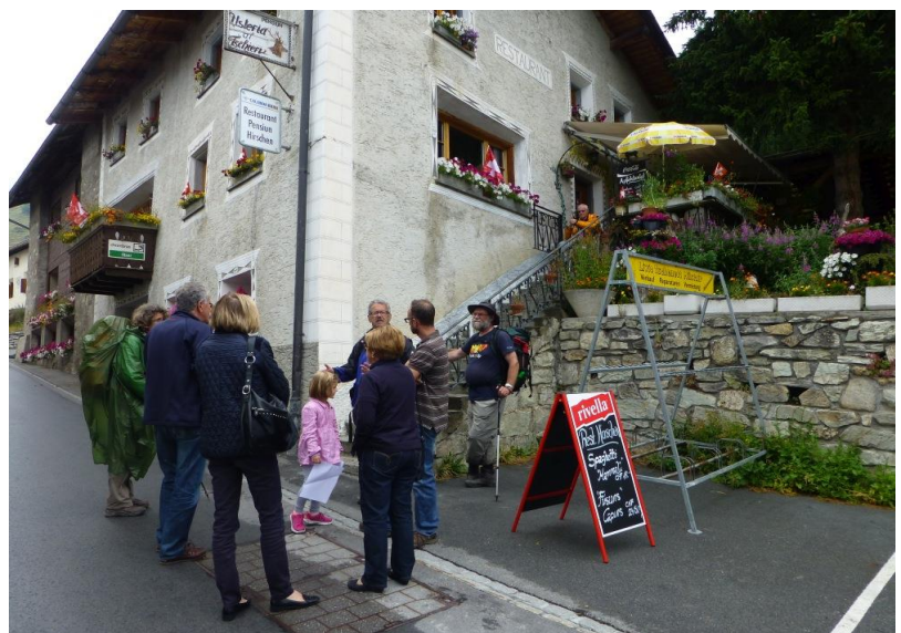
und das Hotel Hirschen