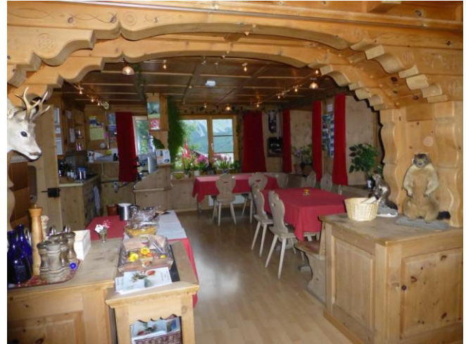
im Hotel Hirschen in Lü