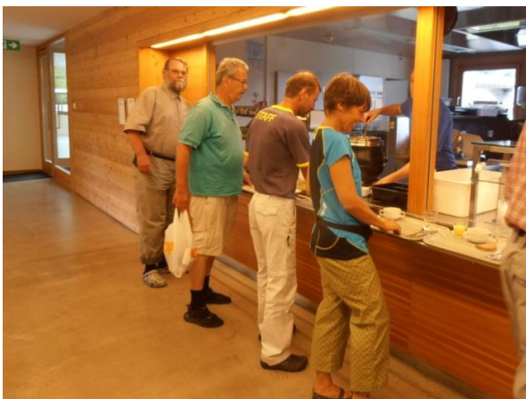
in der Jugi...

In so einer komfortablen Jugi war ich noch nie, alles neu und perfekt eingerichtet. Wir haben Vierer-Zimmer mit WC und Dusche. Jedes hat trotz Kajütenbett immer auch noch genügend Platz, aufrecht auf dem Bett zu sitzen und hat ausserdem auch sein eigenes Licht und Steckdose, gut um sein Handy zu laden. Auch ein abschliessbarer Kasten, wo auch der grösste Tramper-Rucksack Platz drin findet, ist für jeden vorhanden.