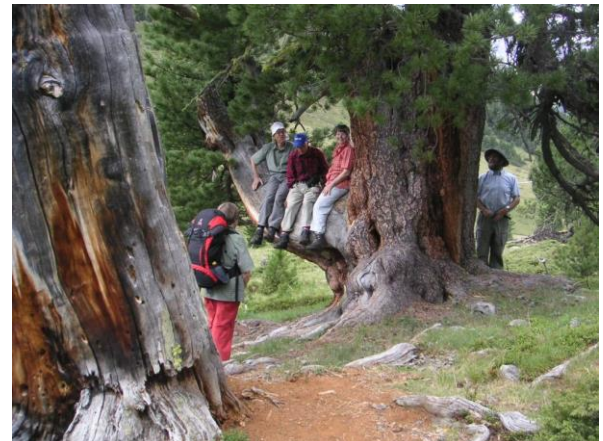
...hat sie uns alle getragen