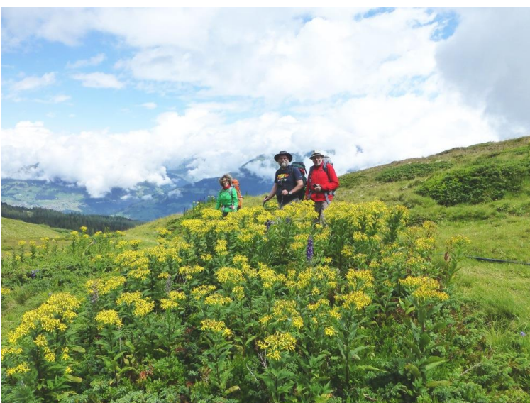
Fuchs'sches Geisskraut und blauer Eisenhut