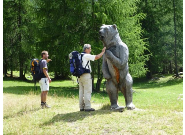
Guten Tag Herr Bär

So sind wir bereits in Schmelzra angekommen, dem Bergbau- und Bärenmuseum bei S-charl. Die Funktion eines Kalkofens wird einem hier am Wegrand erklärt, denn Silber- und Bleierz wurde hier am Mot Madlain abgebaut und eingeschmolzen. Der grosse hölzerne Bär aber, der einen vor dem Museum begrüsst, soll an den letzten Schweizer Braunbär erinnern, der 1904 hier erlegt wurde.