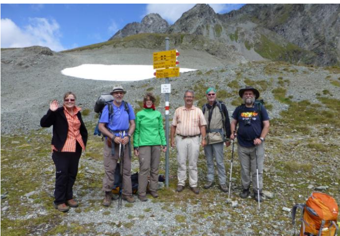
am Pass dal Vereina 2585 m

Wir schreiten durch eine mit Margriten übersäte Wiese. Viel weiter hinten in diesem Hochtal dann der Passübergang. Direkt dahinter türmen sich die nackten, massigen Felsen des Piz Linard und je näher wir dem Pass kommen, desto mehr gibt der Piz von seiner bizarren Statur unseren Blicken frei. Links von ihm erscheinen zwei kleinere Hörner, der Piz Sagliains und der Piz Zadrell, welche zwischen sich einen breiten, flachen, hellblau schimmernden Gletscher einrahmen.