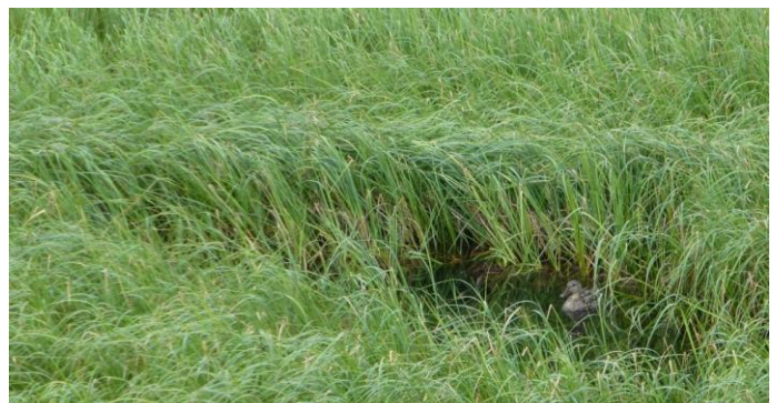
einsame Ente im Schilf