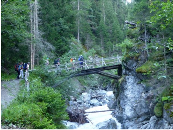
Brücken in der Clemgia-Schlucht...