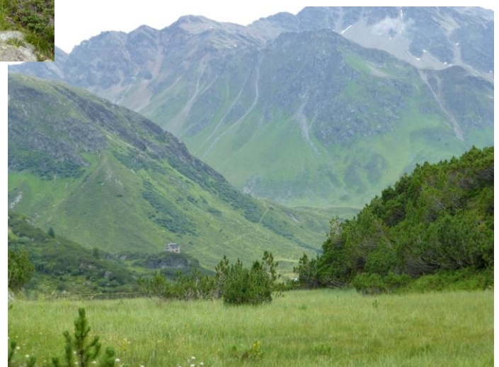
das Vereina Berghaus und der morgige Weg