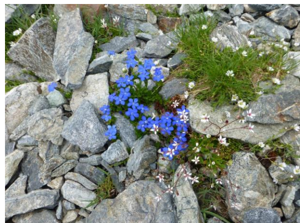
Frühlings-Enzian und Miere