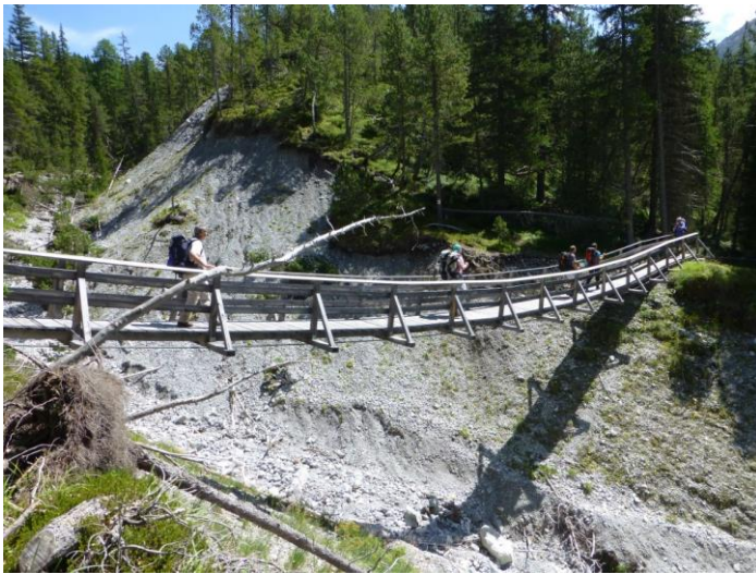
über die schaukelnde Hängebrücke

Grün aus weichem Moos, welches Baumstrünke und einfach alles am Boden Liegende mit einem weichen Vlies überzieht, so dass man die grösste Lust bekommt, sich dort hineinzubetten. Doch die Kneipper haben ihre prickelnden Füsse bereits wieder in ihre Schuhe gesteckt und weiter geht's, über eine richtige Hängebrücke, die ganz schön wackelt. Also alles in allem eine aufregende und sehr abwechslungsreiche Strecke, wo man viel verpasst hätte, wäre ein Postauto gefahren.