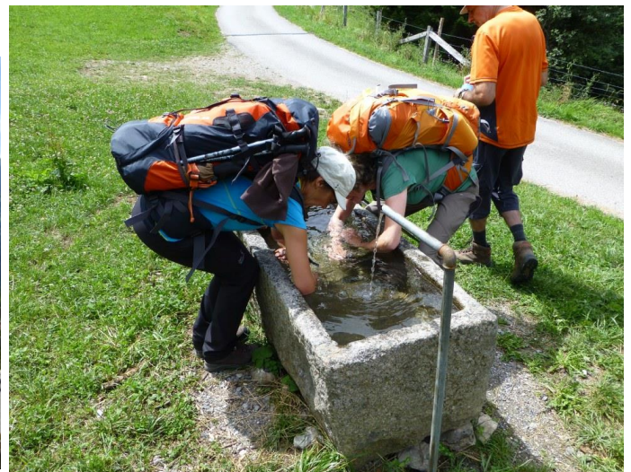
kneippen im kalten Wasser

Ansonsten geniessen wir heute einen schönen und sonnigen Wandertag, vorbei an einer alten Mühle, einsamen Gehöften und Schobbern und vielen plätschernden Brunnen, welche sich als prickelnde Kneipp-Gelegenheiten anbieten. Die Unterarme bis zum Ellbogen ins eiskalte Wasser getaucht, vermittelt augenblicklich neue Energie und frischen Tatendrang. Am gegenüberliegenden Hang die Schanfigger Dörfer St.Peter und Peist und ab und zu windet sich auch der rote Wurm der RhB durch Tunnels und Viadukte über grüne Wiesen und Wälder.