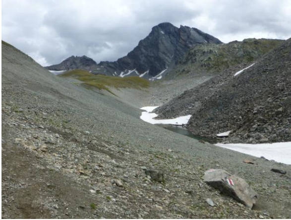
der Piz Linard taucht auf