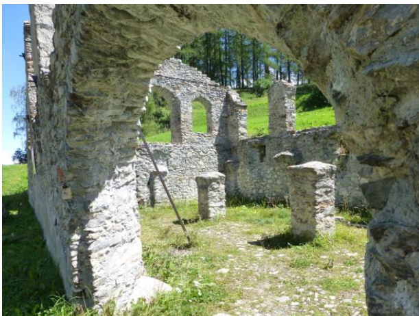
Chanoua, einstige Herberge aus dem 9. Jahrhundert