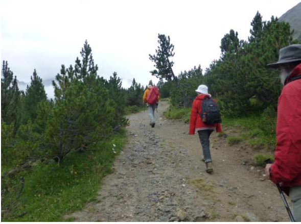
jetzt sind es Legföhren