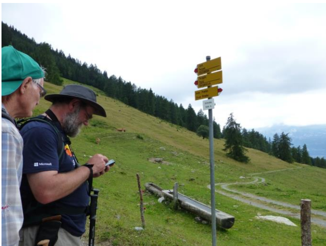
wir sind erst auf 1494 Meter