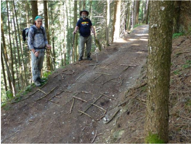
Herbi, Rita und Knut heisst's