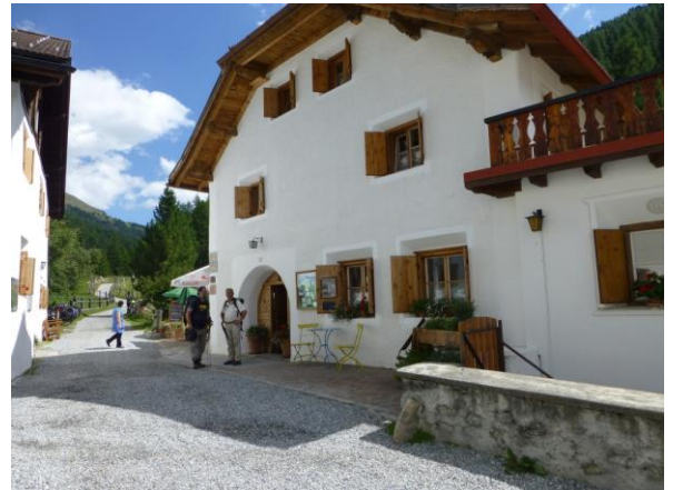
Ankunft im Crusch Alba