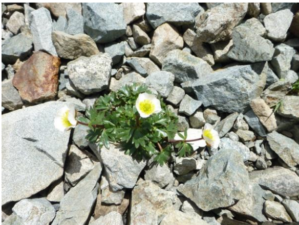
Gletscher-Hahnenfuß (Ranunculus glacialis)