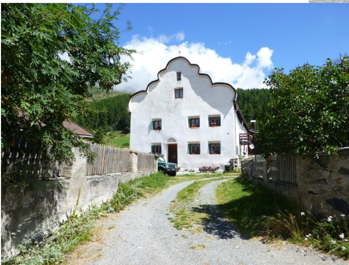
Giebfassade in Bos-cha