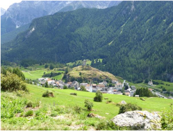
Ardez und Steinsberg