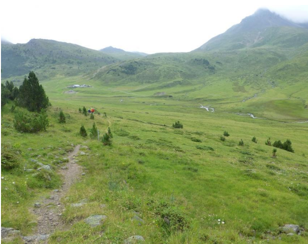
auf der Alp Astras

nützt wird, hinüber zur Alp Astras, wo wir letztes Mal zu einer Milch und Hirschsalsiz eingekehrt sind. Diesmal lassen wir die Alphütte links liegen, es ist einfach zu unfreundlich und kalt, man will in Bewegung bleiben. Hinter dem Haus teilt sich nun der Weg: der eine führt hinauf zum Ofenpass und dem andern folgen wir immer noch sachte ansteigend Richtung Pass da Costainas. Hier ist die Clemgia noch jung und munter mäandert sie durch das satte Grün der Alpweiden, während uns der steinige Weg durch einen niedrigen Wald aus Legföhren immer mehr dem Nebel entgegen führt.