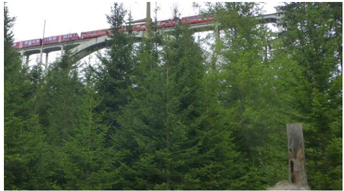
60 Meter über uns