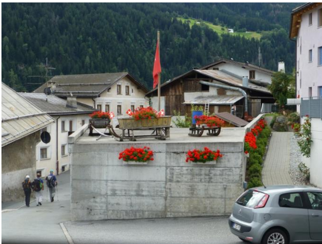
willkommen im Dorf

Auf der Alp Ruinatscha sieht man dann wieder ins Münstertal hinunter. Wir haben jetzt gerade die Hälfte des Abstiegs und es ist Zeit für eine Rast. Die Ortschaft, die man von hier aus sieht, ist aber nicht Müstair, sondern Taufers, welches bereits in Italien liegt. Man kann die Zollstation sehen, also sitzen wir grad unmittelbar an der Landesgrenze am östlichsten Zipfel der Schweiz.