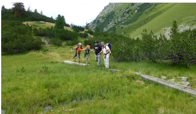
Schwalbentanz im Moor