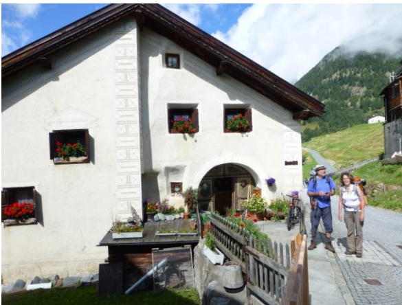
in Guarda angekommen