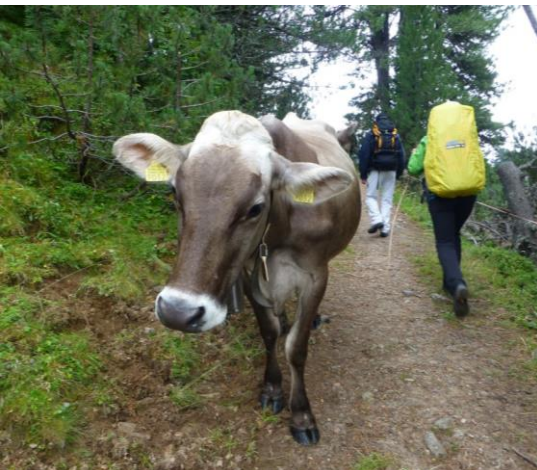
eine schöne Dame