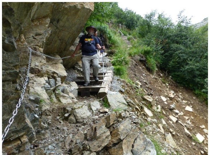
die nächste Stufe mit Treppen