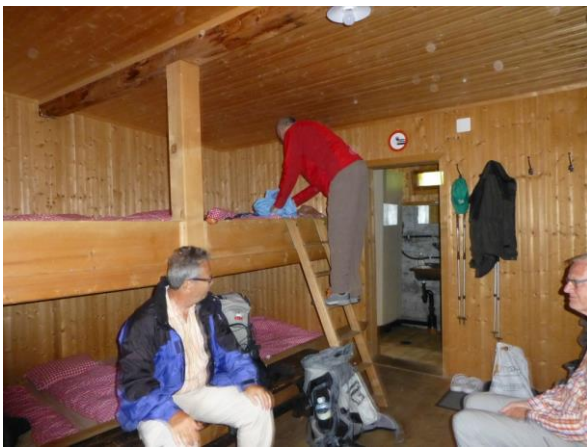
genug Platz, sogar mit Dusche