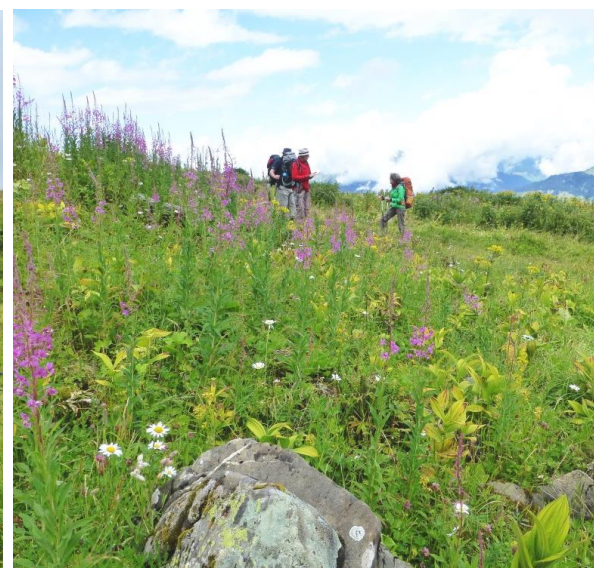
Weidenröschen in Germer- und Enzianwiesen