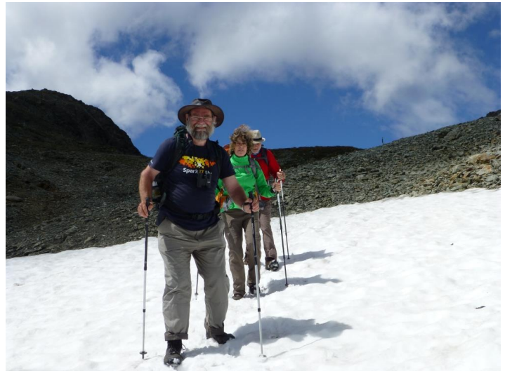
juhui - Schnee

gebüsche. Zum Wandern ist es wunderschön, aber man muss sehr aufpassen, dass man nicht in vom Gras versteckte Löcher tritt. Ausserdem beginnt es jetzt auch zu regnen, was die Steine jetzt glitschig macht. Wir sind nun bei der nächsten felsigen Stufe angelangt, welche aber ganz neu mit Treppenstufen und einer Kette gesichert wurde. Zum Glück besinnt sich das Wetter und leert wohl sein Nass etwas weiter hinten im Tal aus. Endlich kommt das Tal in Sicht und man sieht gemähte Wiesen. Vor dem ersten Haus, das am Weg liegt, plätschert verlockend ein Brunnen, an welchem wir uns erlauben, die leeren Flaschen nochmals aufzufüllen.