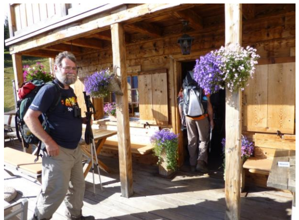
Empfang mit überquellenden Blumentrögen