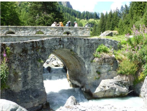
Brücken über die oder den Tasnan

Wir folgen nun wieder dem Weg Nr. 43, dem Jakobsweg Graubünden, bleiben aber oberhalb Ardez, das sich zu unseren Füßen um die Ruine auf dem Steinsberg zu gruppieren scheint. Auch an unserem Weg liegt ein altes, zerfallenes Gemäuer. Diesmal nicht eine Kirche oder Burg, sondern eine alte Herberge aus dem 9. Jahrhundert, wie man aus einer interessanten Infotafel erfahren kann. Eine Sust oder Wirtschaft Chanoua, die einmal an der Verbindungsstrasse ins Tirol gelegen hat.