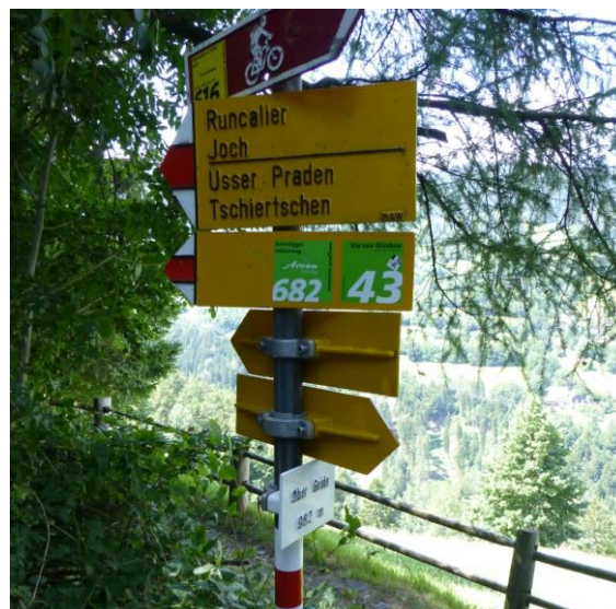
in Grida sind die andern eingestiegen