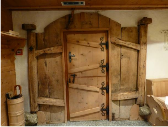
Haustüre im Crusch Alba