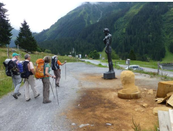
Freilichtatelier der Holzbildhauer