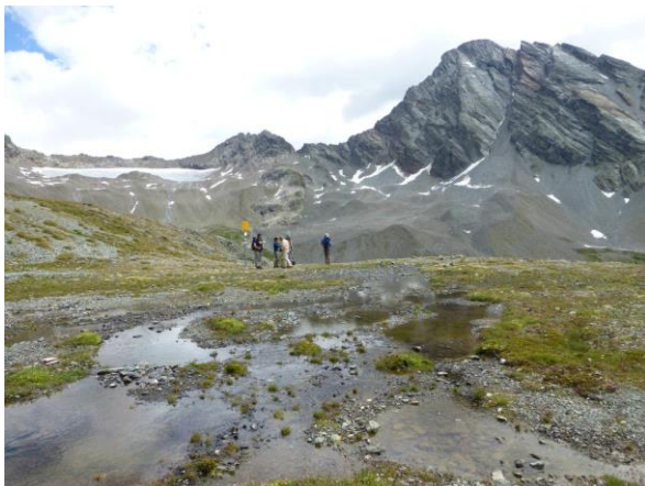
Gletscher und noch mehr Hörner