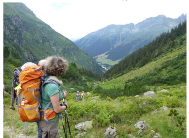
endlich auf der Stutzalp

Die Terrasse vor dem Haus ist ziemlich besetzt. Da warten wohl die meisten auf die Abfahrt des fahrplanmässig verkehrenden Vereina-busses.