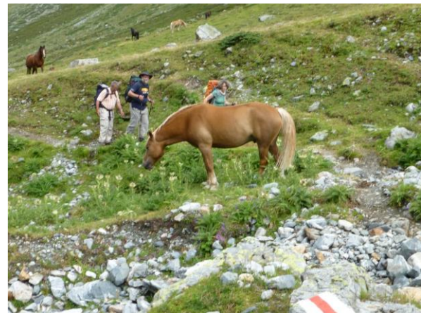
Pferdeweiden im Süsertal