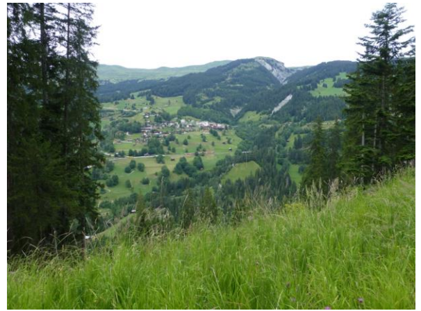
Peist im Schanfigg