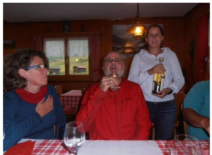
der Iva-Schnaps wird degustiert