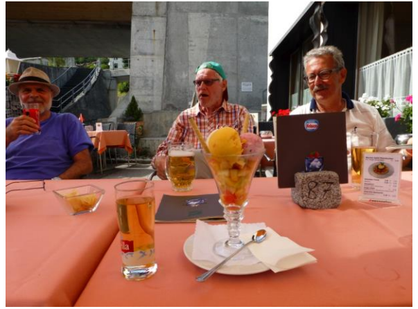
Zivildienst-Einsatz in Ftan

An einer Abzweigung sind wir uns nun nicht sicher, welchen von beiden Wegen nach Ftan sie weitergegangen sind. Ein Weilchen später aber warten sie schön am Schatten, bis man sich wieder vereint an den Einmarsch in Ftan macht. Vor dem Dorf wird an einer längeren Strecke an einer neuen Trockenmauer am Strassenrand gearbeitet. Es ist ein Einsatz der Zivildienstgruppe, welche sich hier ausnahmsweise einmal an einem nützlichen Projekt beteiligt. Alles junge, starke Burschen, die unter der Leitung eines Profis die längst fällige Reparatur einer Stützmauer ausführen.