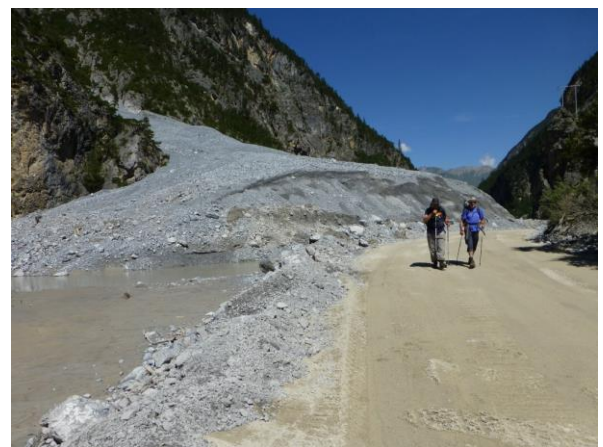
alles war verschüttet