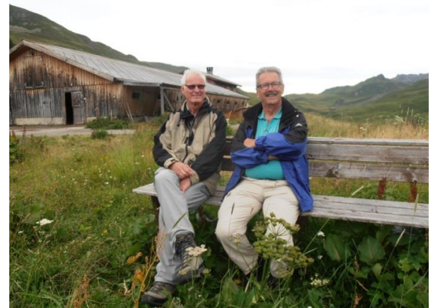
bei der Alpkäserei im Fondei