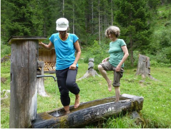
die Störche kneipen