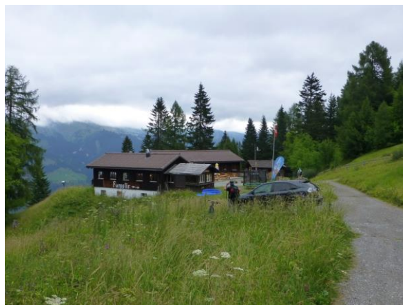
Ankunft im Furggkis