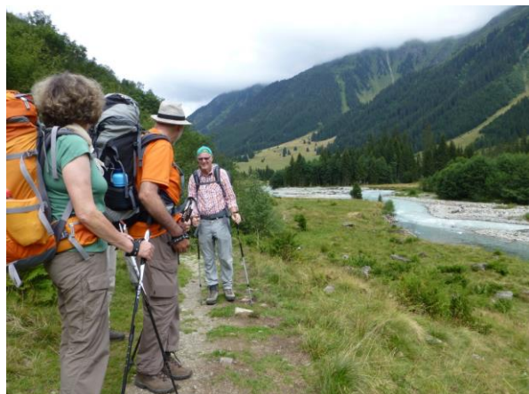
Verstancla und Vereinabach vereinen sich