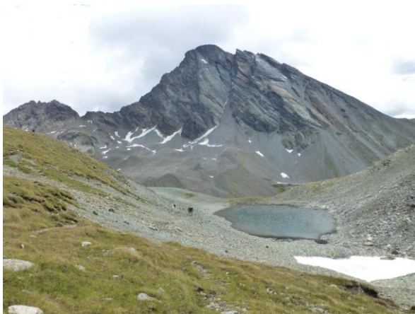
der See am Vereinapass und Piz Linard gegenüber