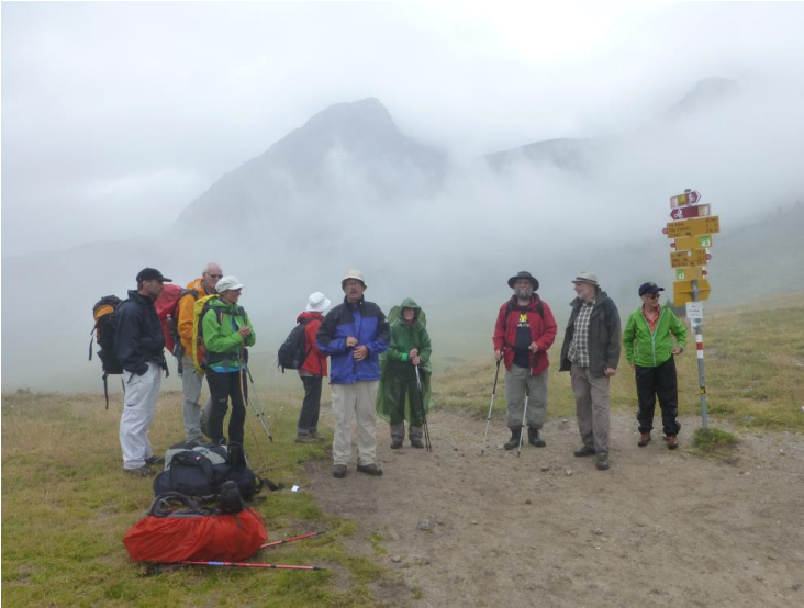
auf dem Pass Costainas