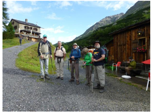
beim Abmarsch ist wieder blauer Himmel

Mehr oder weniger sanft ansteigend zieht sich das Süsertal dahin. Überall blüht nun bereits der blaue Eisenhut und im kiesigen Grund neben dem Bach Iva, die Moschus-Schafgarbe für den Schnaps. Eine ganze Wiese voll „Chutzbuebe“, wie ich die verblühten Schwefelamonenköpfe nenne, glänzen in der Morgensonne und ganz zuhinterst im Tal weiden da einfach Pferde. Wunderschöne Pferde mit blonden und schwarzen, wehenden Mähnen und Schwänzen und fressen genüsslich die kratzigen Disteln. Ab und zu verliert sich der Weg auf der Weide, aber am nahen Steilhang kann man sich gut an den weiss/roten Zeichen orientieren, die senkrecht stehend immer steiler und höher an grossen Felsen angebracht sind, bis man den höchsten Punkt erreicht hat, wo man vorher nur noch Himmel sah. Nur, an dieser Kante geht's erst mal über einen Bach und ein Schneefeld flach weiter. Flesspass heisst es hier und an lieblichen Seen weiden braune Kühe.