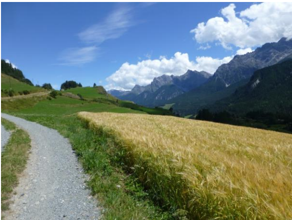
Gerste für's heimische Bier?