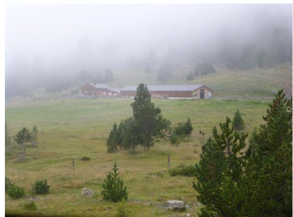
...auf der Alp Campatsch

Es ist ein grosses, neues Gehöft. Der moderne Stall ist leer, da irren wohl alle Bewohner draussen im feuchten Nebel umher. Auf der grossen Terrasse vor dem Haus hat niemand Lust, abzusitzen, obwohl uns drei Kinder höflich dazu auffordern. Die geschlossenen Sonnenschirme tropfen noch und Stühle und Bänke sind auch nass. Die Rucksäcke deponieren wir draussen unter dem Vordach, denn die Gaststube ist winzig klein. Wenn wir ein bisschen zusammensitzen, haben wir am langen Tisch neben den drei anderen Gästen gerade alle Platz. Eine heisse Suppe wäre sehr willkommen und man kann sogar von drei verschiedenen Sorten eine wunderbare, selbstgemachte Bündner Gerstensuppe wählen. Auch gebacken hat man, schliesslich ist heute der erste August, nur leider spielt das Wetter überhaupt nicht mit. Die Familie mit den Kin-