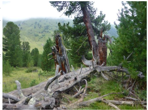
die uralte Arve heute...