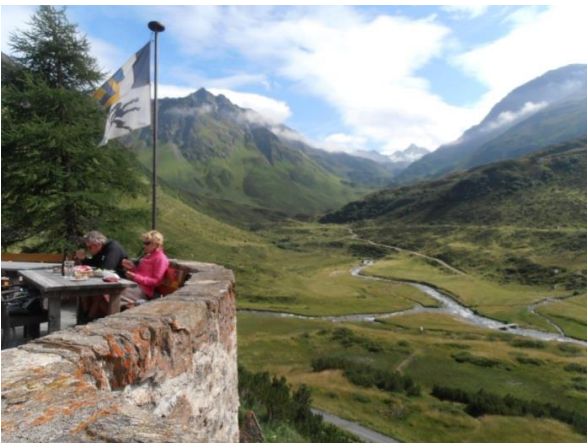
wo unten der Vereinatunnel druchgeht