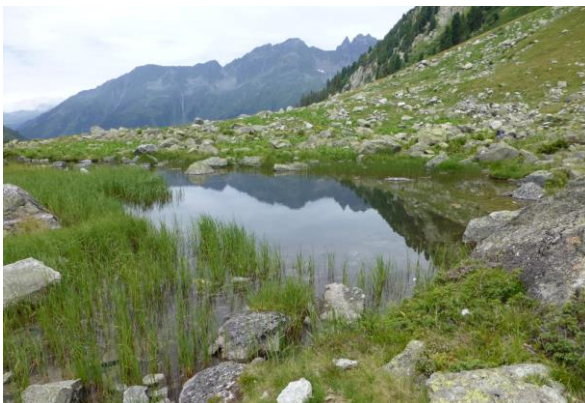
mit spiegelnden Seelein