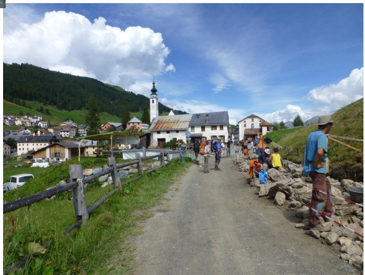
Zivildienst-Einsatz in Ftan