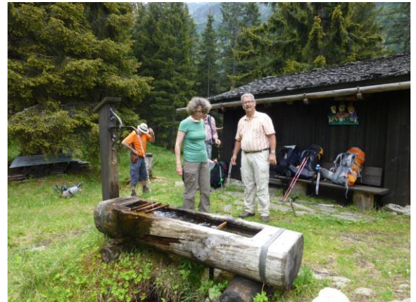
anstatt Kaffee, eine Kneiprunde

Eine halbe Stunde später haben wir dann den ärgsten Stutz bezwungen und oben auf der Stutzalp, nomen est omen, laben sich unsere Augen an etwas weniger steilen Alpweiden und spiegelnden Seelein.