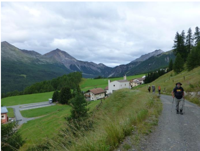
heute sieht man wenigstens die Gegend