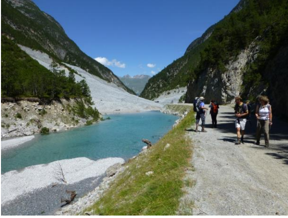
auf der Strasse nach S-charl