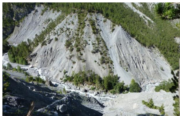
Erosion in der Schlucht

Unser Weg führt uns also bald im kühlen Schatten steiler Felswände über Brücklein hin und her über einen immer noch ziemlich wilden Bach, der auf seinem abenteuerlichen Weg in den letzten Tagen recht viel zersplittertes und geschundenes Holz von Stämmen und Wurzelstöcken mitgeschleppt hat. Spuren der Verwüstung sind aber auch hier auszumachen. Wir wagen uns über ein Brücklein, dessen Holz noch ganz neu ist, aber dessen tragender Balken bereits wieder arg verkantet unter der Brücke durchhängt. An einer andern Stelle liegen noch die Sägespäne am Boden und wir überschreiten ein nagelneues, fixfertiges Brücklein. Ein paar Meter oberhalb in einer Zuflussrinne des Bachs hängt drohend ein riesiger Felsbrocken, welcher es ganz offensichtlich beim nächsten Unwetter dann schaffen wird, auch diese Brücke zu zerschmettern. Vorsorglich hat man hinter dem nächsten Felsvorsprung bereits das nötige Holz zugeschnitten bereit gelegt, um das Brücklein dann gerade ein zweites Mal wieder neu zu erstellen.