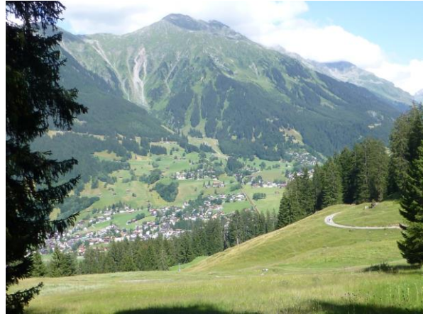
erster Blickkontakt mit dem Alpenrösli

Aber sonst ist diese Herberge hier ein Hit. Hierher kommt man, wenn man gediegen ausgeht. Das Berghaus Alpenrösli landete letztes Jahr im Fernsehen auf der kulinarischen Reise durch ‚mini Beiz, dini Beiz‘ auf dem 1. Platz. Gediegen ist der Tisch gedeckt und umwerfend das Menü. Das Kotelette ist so dick, wie nie und die Rösti so knusprig, wie schon lang nicht mehr. Wir befinden uns dieses Jahr auf unserer Sommerwanderung wohl auch auf kulinarischen Höhenflügen.