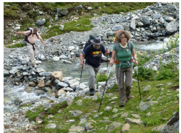
über den Süserbach