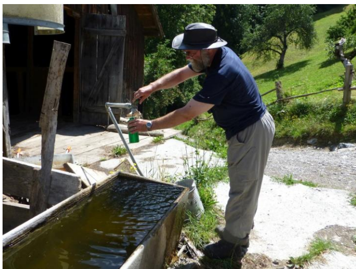
Passugger beim Bauernhof

An der Endstation, noch ganz unten an der Plessur beginnt nun bereits der Anstieg, meist durch angenehm schattigen Wald und rasch gewinnen wir an Höhe, überqueren bei Passugg die Postautostrasse und gleich geht's weiter wieder durch Wald und Feld. Bei einem Bauern plätschert im Hof der Brunnen. Da muss ich mir gerade meine Flasche mit richtigem Passugger auffüllen. Es ist zwar nicht von der eigentlichen Mineralquelle, an dieser Abfüllstation sind wir gar nicht vorbeigekommen.