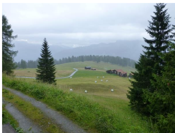
und schon regnet's