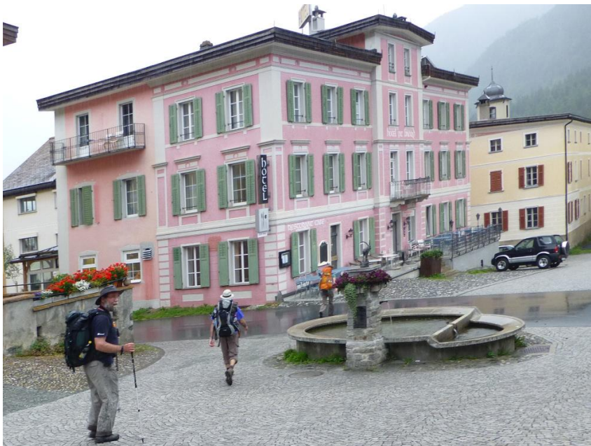
Hotel Piz Linard in Lavin