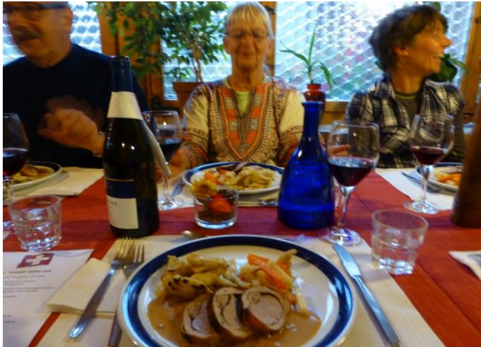
Schweinsfilet im Speckmantel