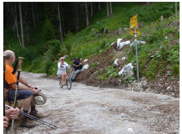
es ist auch Mountainbikeroute