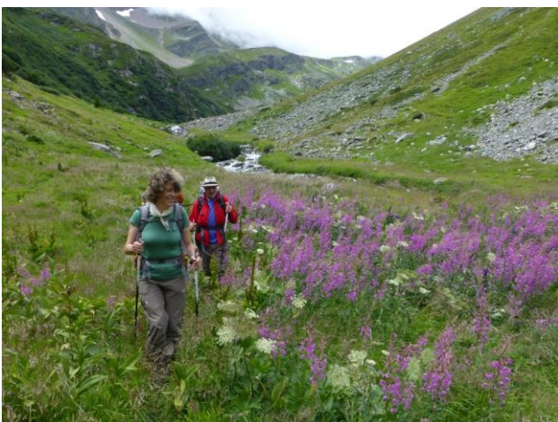
durch hüfthohe Blumenwiesen

tosenden Bergbach und beruhigt sich dann unten, genau wie der Wind und munter schlängelt es sich weiter durch hüfthohes Gras und Weideröschen und die ersten Erlen-